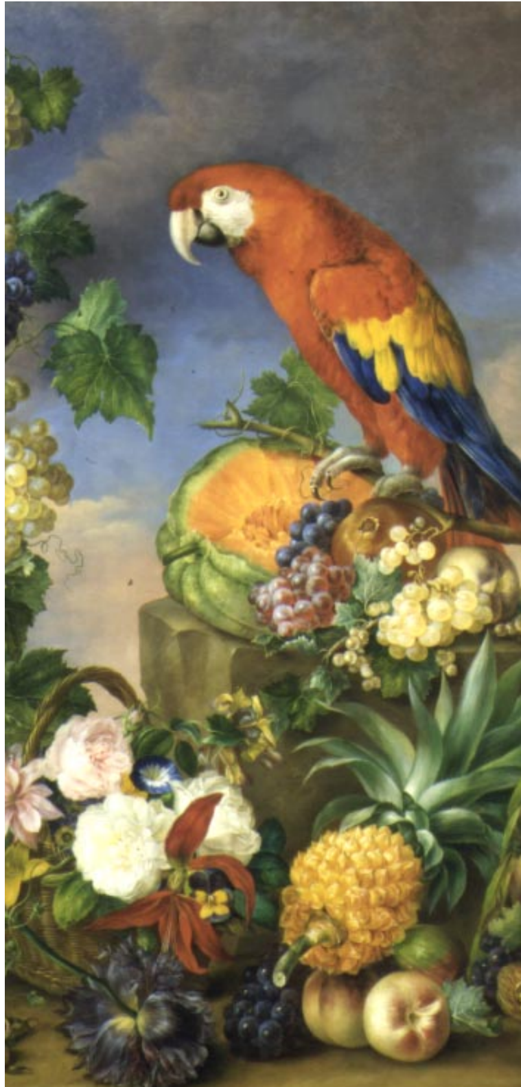
Petter FX »Stilleben med frukter, blommor och papegojor« signerad 1849,. Sälld för 220 000 kr.

Våra auktoriserade värderingsmän utför skriftliga värderingar för bouppteckningar, arvskiften och försäkringar. Förutom privatpersoner utnyttjar bland annat banker, försäkringsbolag, advokatbyråer och begravningsbyråer dessa tjänster.