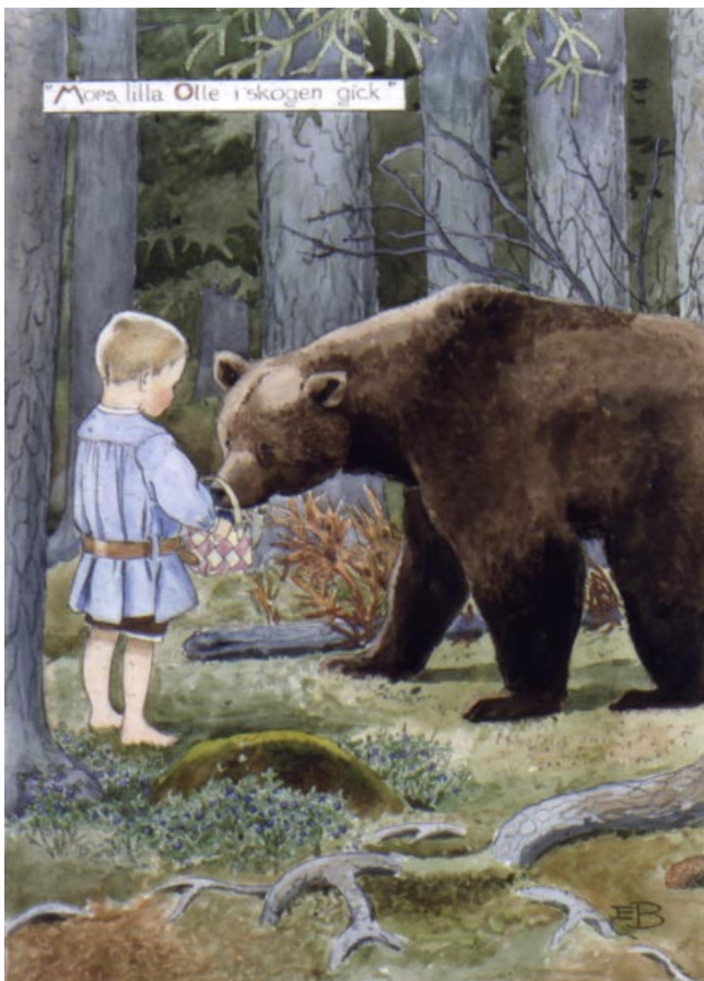
Elsa Beskow »Mors lilla Olle i skogen gick...« 1 av 4 akvareller sålda för 1 740 000 kr. Finns nu att beskåda på Nationalmuseum.

Gustaviansk byrå av Georg Haupt, signerad och daterad 1775. Sald för 3 050 000 kr.