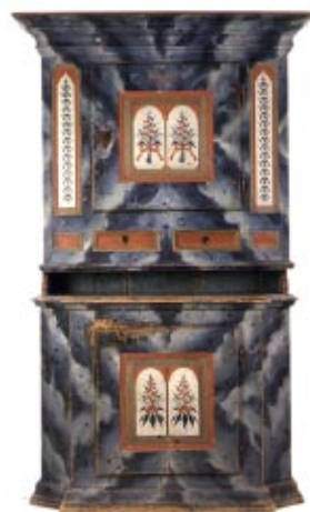
Skänkskåp, märkt AAD, Hälsingland, 1800-talet början. Sålts för 70 000 kr.

Det totala antalet föremål ligger vanligtvis runt 500 per auktion. Visningen pågår tio dagar och spänner över två helger. I samband med auktionerna utges en katalog med ett stort antal bilder, utropspriser samt beskrivning av samtliga föremål.