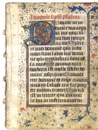
»Horæ Ad Usum Romanum« fragment, Flandern eller Nordfrankrike ca 1450–1475. Sälld för 11 000 kr.

Auktionerna föregås som regel av annonsering i svensk och utländsk fackpress. Dessutom utges separata kataloger med utförliga beskrivningar av samtliga föremål.