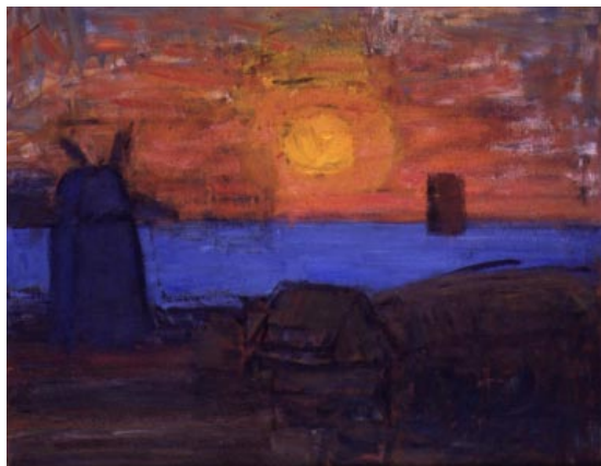
Carl Kylberg (1878–1952), »Stilla Morgon«, olja på duk. Sålđ för 470 000 kr.

Auktionerna hålls på våren och hösten i direkt anslutning till Stora Kvalitén och föregås av samma omfattande marknadsföring. Detta inkluderar annonsering i svensk och utländsk press samt utgivning av exklusiva kataloger i fyrfärg.