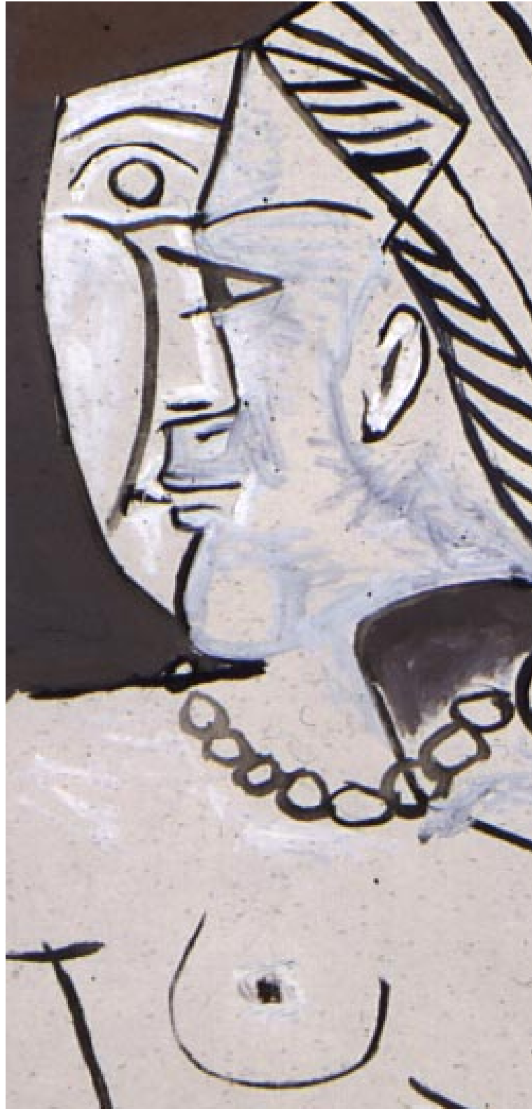
Pablo Picasso signerad 1953, detalj av »Buste de femme au collier«, olja på duk. Sålđ för 5 350 000 kr.