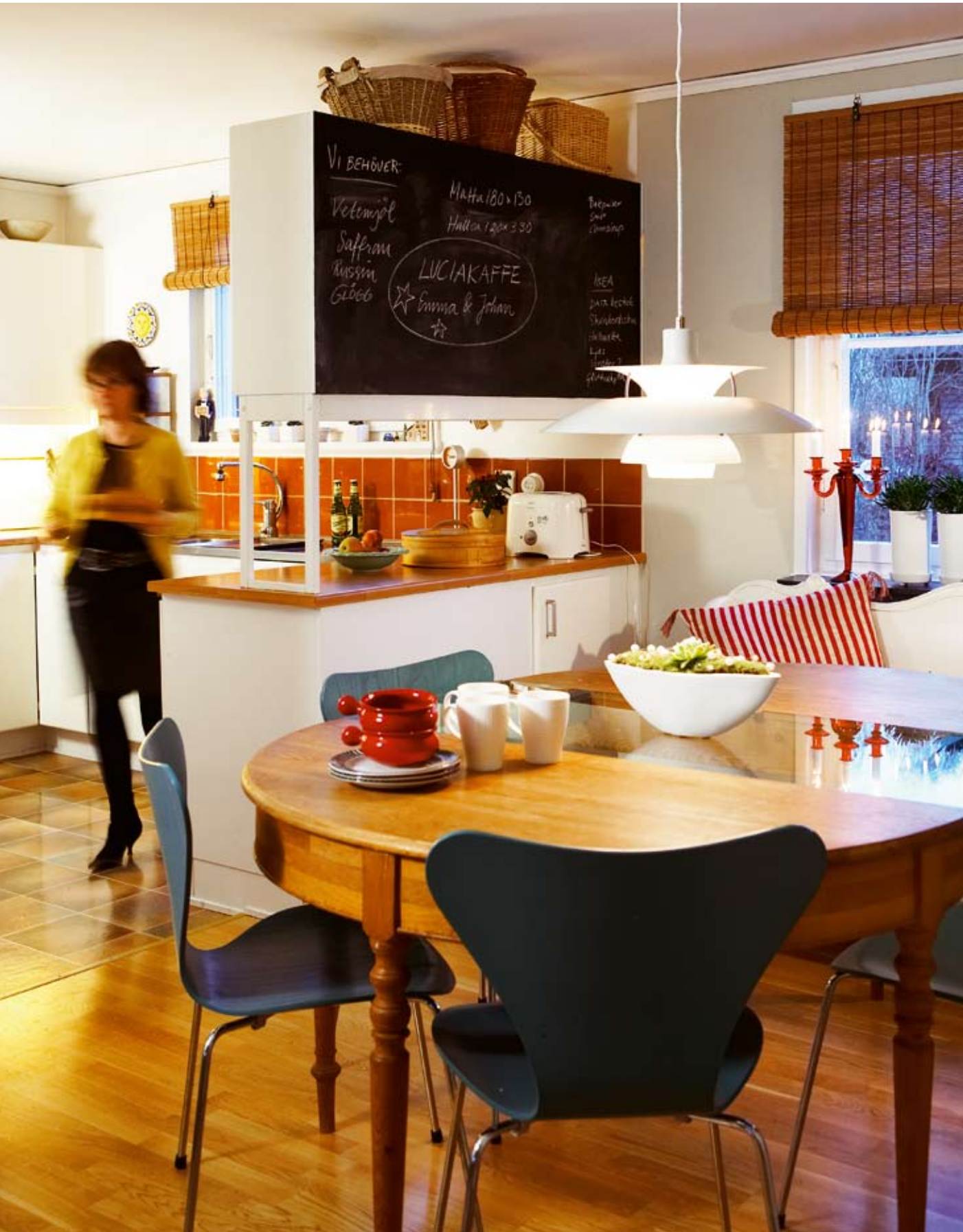
Matplatsen domineras av det gamla furubordet. Idén med iläggsskivan i glas är "stulen". Tvärlåarna är målade i samma färg som Arne Jakobsens Sjuanstolar. Den gråmålade kökssoffan är tillverkad på Gripsholm 1792 och är klädd i svensktillverkat lintyg. Baksidan på porslinskåpet är målat i griffelfärg. Bra för kom-ihåg-listor och meddelanden.

Underst till vänster: En herrbetjänt har piffats upp med en kimono från Japan och olika halsband. Roligare än att ha dem liggande i en låda.