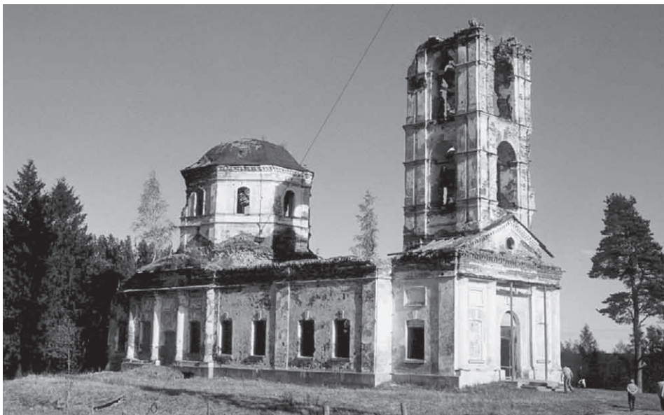
Salmin ortodoksisen kirkon rauniot